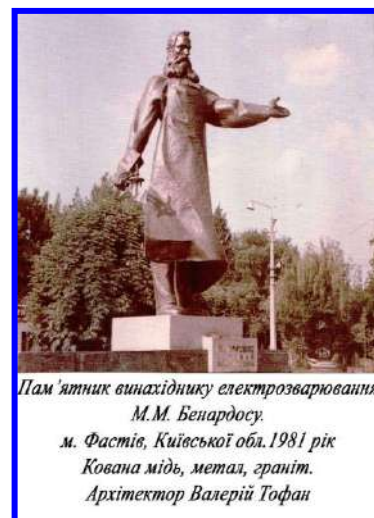
Пам'ятник винахіднику електрозварювання М.М. Бенардосу. м. Фастів, Київської обл. 1981 рік Кована мідь, метал, граніт. Архітектор Валерій Тофан

В липні 1981 року за участю фахівців Інституту електрозварювання імені ім. Є.О.Патона в селищі Лух Івановської області РФ був створений музей, присвячений життю і винахідницькій діяльності М. М. Бенардоса (нині Лухський краєзнавчий музей імені М. М. Бенардоса) та споруджений пам'ятник винахіднику.