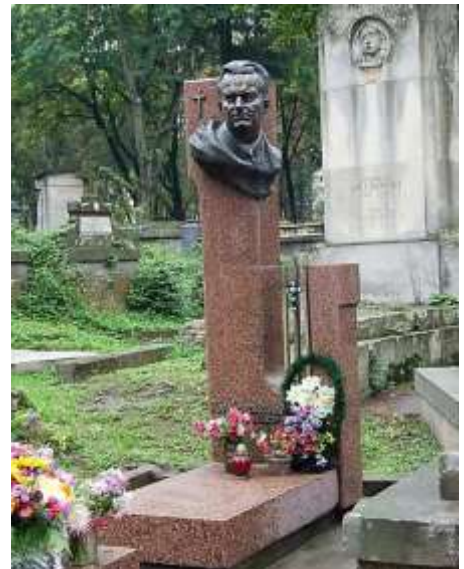
Могила А. Кос-Анатольського

Лауреат державної премії СРСР (1951), Лауреат Державної премії ім. Т. Г. Шевченка (1980) за збірку «Вокальні твори», Народний артист України (1969).