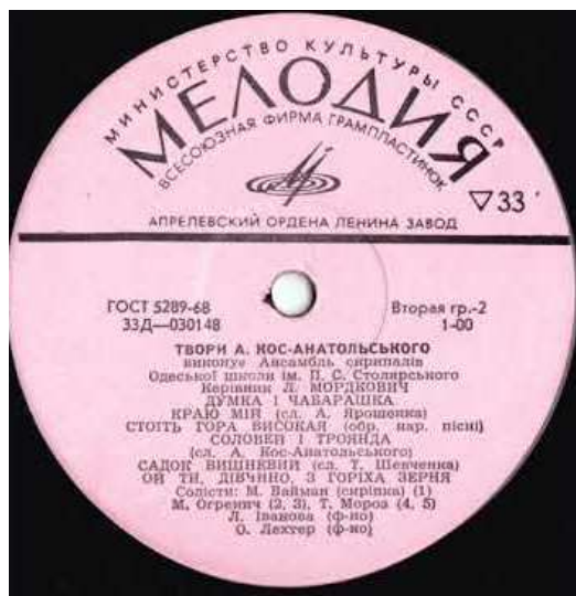
Грампластинка з творами А. Кос-Анатольського

Карпатське озерце [Ноти] / муз. А. Кос-Анатольського, сл. С. Жупанина // Пісенник : зб. пісень для 5-8 кл. загальноосвіт. шк. / упоряд. В. Я. Кващук. – Тернопіль, 1999. – С.23-24.